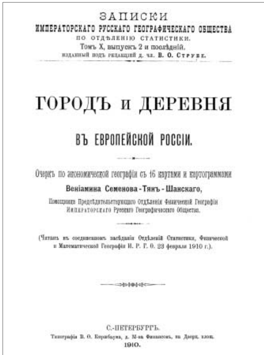
Рис. 1.1.3. Титульный лист книги «Город и деревня в Европейской России»