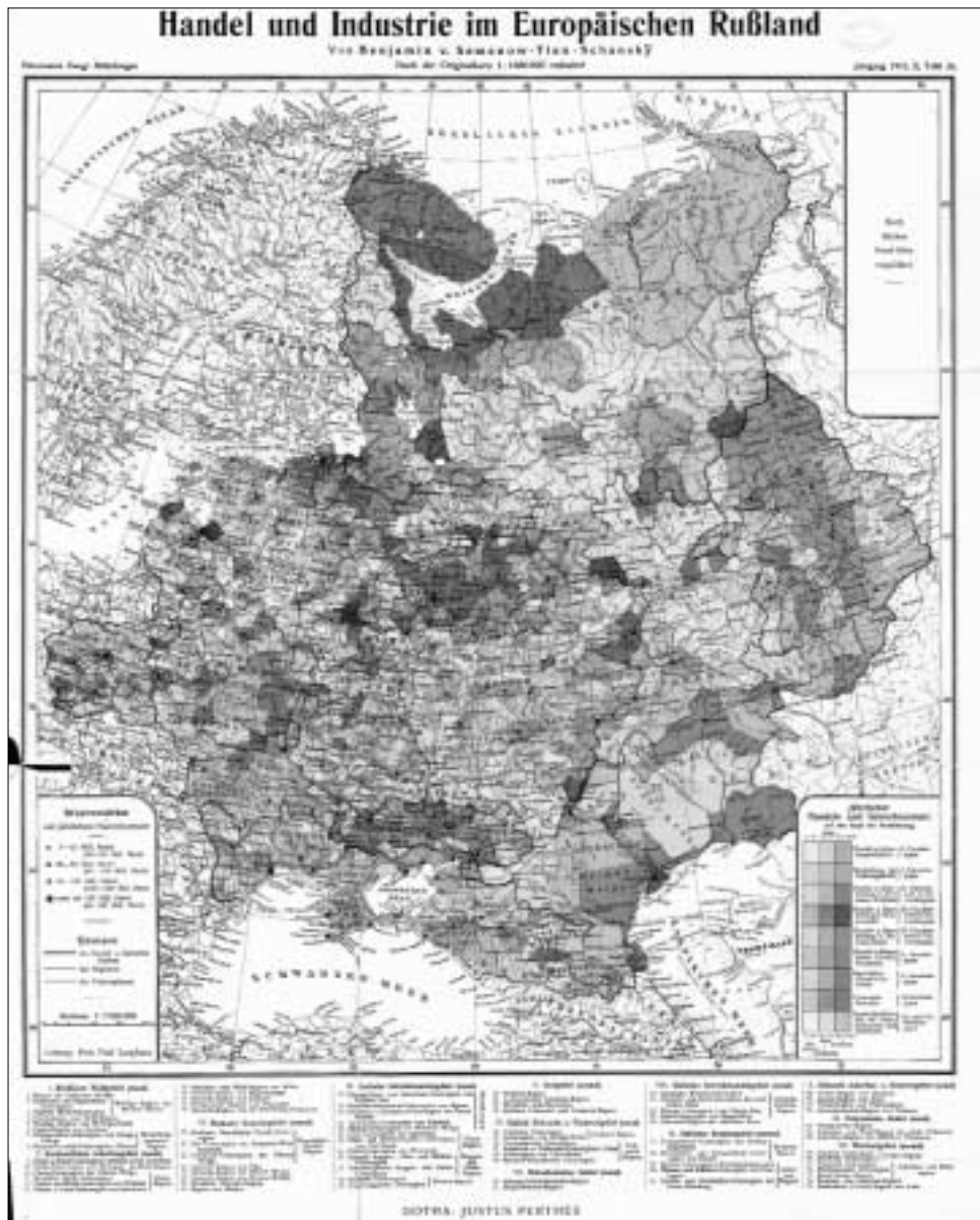
Рис. 1.1.4. Карта «Торговля и промышленность в Европейской России». Вариант немецкого издания 1913 г.