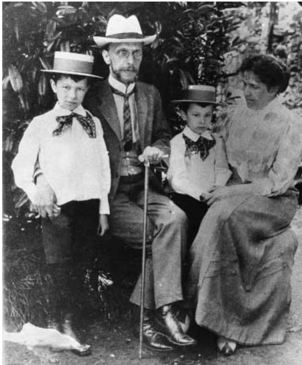
Рис. 1.1.1. В. П. Семенов-Тян-Шанский с семьей