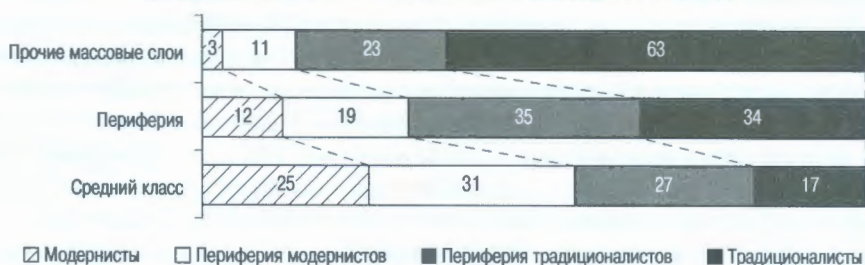
Рис. 3. Показатели итогового индекса модернизированности сознания и поведения в разных социальных слоях, 2008 г., в %

Таким образом, совсем не очевиден тот факт, что средний класс уже самим фактом своего наличия обеспечит успешное продвижение России по пути модернизации, хотя пока он в большинстве своем действительно может служить опорой при модернизации страны. В то же время дальнейший рост его численности за счет периферии может привести к качественному изменению этой картины. Не случайно если в 2006 г. средний класс составлял в экономически активном городском населении 35%, то в 2008 г. — уже 41%.