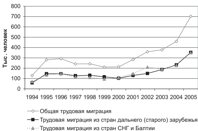
Масштабы трудовой миграции в Россию по данным ФМС в 1994–2005 гг.