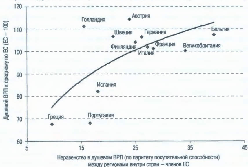
Рисунок 2. Душевой ВВП и региональное неравенство в странах ЕС (2000 г.)

Однако в этом случае появляется необходимость выбора между справедливостью и экономической эффективностью. К сожалению, взаимосвязь между данными параметрами довольно тяжело оценить количественно. На рис. 2 показана зависимость между степенью неравномерности регионального развития и ВВП на душу населения для 15 наиболее развитых