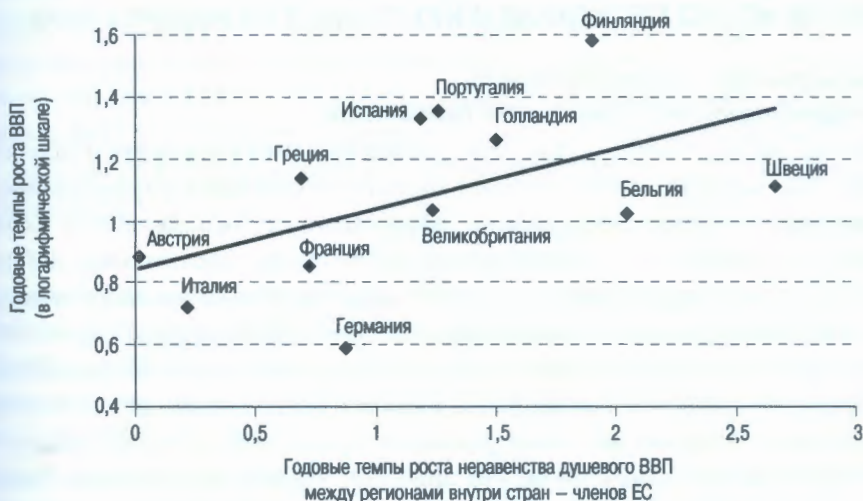
Рисунок 3. Экономический рост и региональное неравенство в странах ЕС (1995–2000 гг.)

Другое свидетельство в пользу положительной взаимосвязи между концентрацией производства (пространственным неравенством) и экономической эффективностью приводится в работах А. Ciccone и R. Hall [Ciccone, Hall, 1996] для США и А. Ciccone [Ciccone, 2002] для Европы. Основной вывод обеих работ состоит в том, что концентрация рабочей силы положительно влияет на производительность. Последние эконометрические исследования М. Crozet и Р. Koenig [Crozet, Koenig, 2005] дают более точную картину для Европы. Подтверждается положительная взаимосвязь между темпами роста ВВП на душу населения и ростом неравенства в регионе. Данный эффект экономически значим: рост на 10% стандартного отклоне-