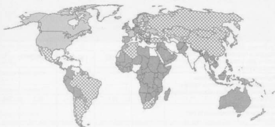
Рисунок 1. Доля безработных, получающих пособие в рамках установленных законом программ по безработице, финансируемых за счет страховых взносов или налогов (действующее обеспечение)

Получатели пособий по безработице (процент от общего числа безработных):