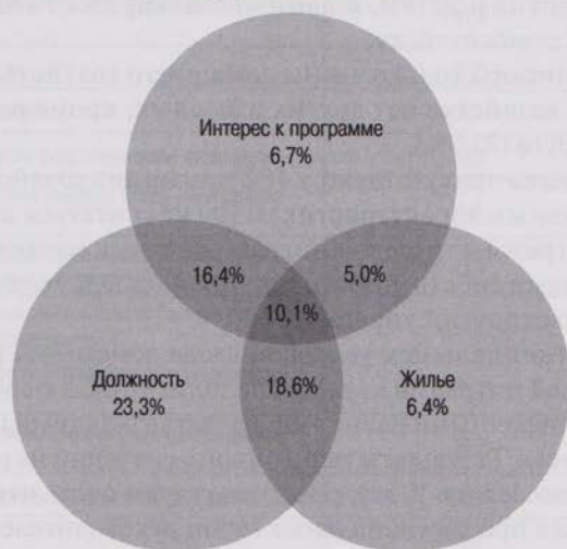
Рисунок 2. Возможности и ограничения входа домохозяйств трудоспособных в программу поддержки трудовой миграции посредством специализированных ипотечных программ, в % от числа опрошенных семей, имеющих в своем составе трудоспособных