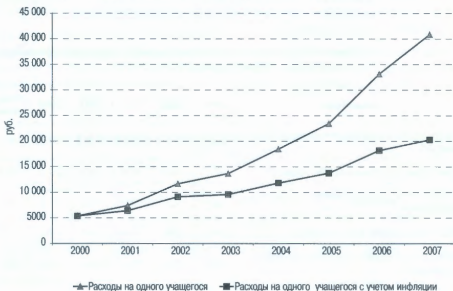
Рисунок 1. Динамика номинальных и реальных бюджетных расходов на одного учащегося в системе общего образования в 2000–2007 гг.