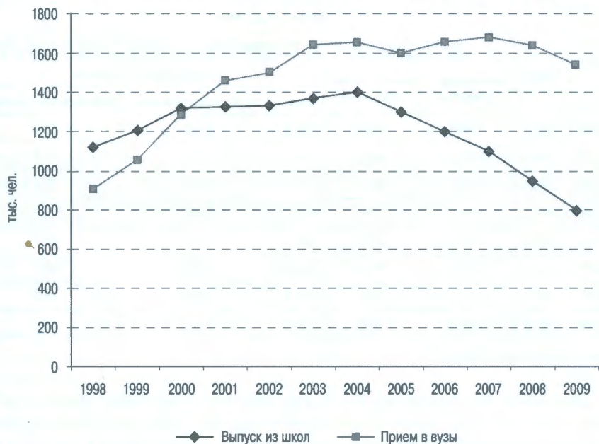
Рисунок 2. Выпуск из общеобразовательных школ и прием в вузы