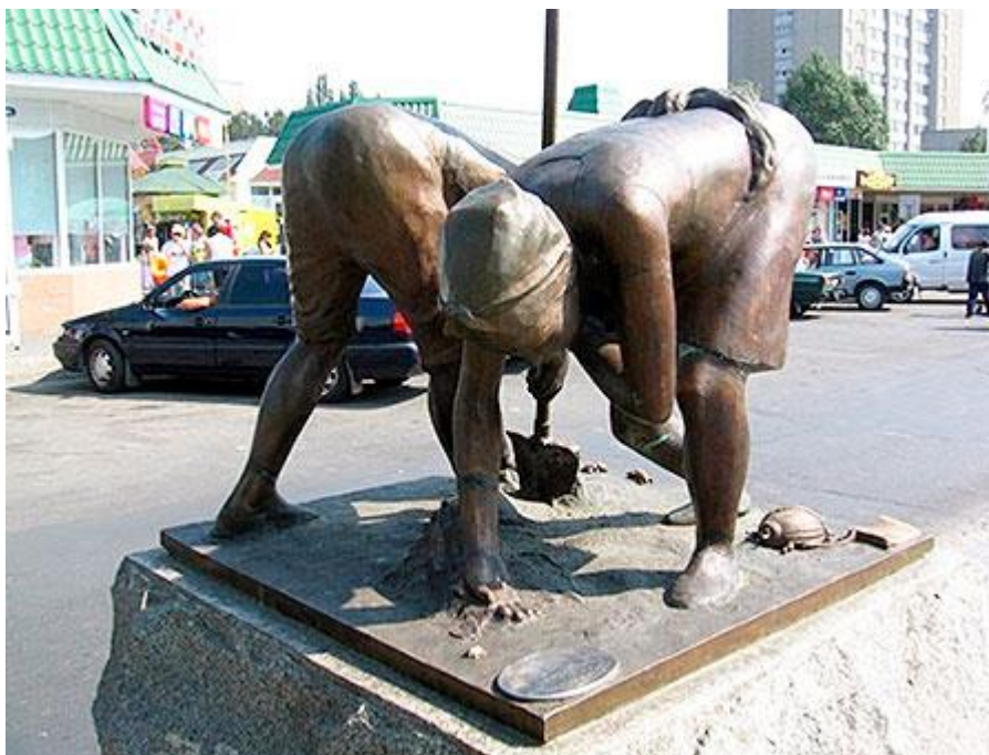
Рисунок 2. Памятник дачникам у железнодорожного вокзала в Бердянске (Украина)

И снова: кто же такой дачник? Горожанин, временный селянин? Дауншифтер, как нечто промежуточное между карьеристом и пофигистом? Работяга или лодырь? Местный или чужак в деревне, малом городе, пригороде? Странник или домосед? Что вообще тянет его к этой раздвоенной жизни? Вместе с теми факторами-аттракторами, которые принято называть объективными, на массовость и поведение дачников влияют традиции, явные и неявные установки.