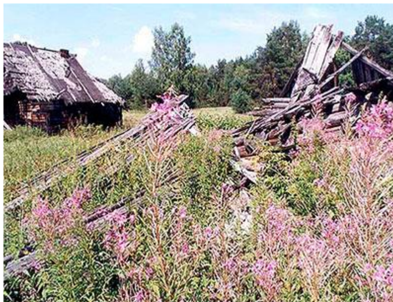
Рисунок 7. Руины малой родины: пример бывшей дачи-ностальжи

владения, порождаемые процессами урбанизации, миграциями в направлении село-город, могут посещаться хозяевами лишь эпизодически – для надзора, ремонта, в порядке ностальгического туризма (roots tourism) или, пока не поздно и есть спрос, продаваться на вторичном дачном рынке.