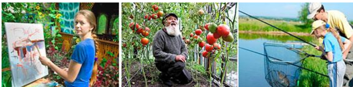
Рисунок 8. Примеры многообразия дачных занятий

Резон 5. Трудовой: ведение профессионального дела в иной среде либо его смена для развлечения, приработка, самоснабжения, самореализации, отдыха (тогда этот резон сближается с рекреационным за номером 1). Все возможно в ином месте, но дача обычно предоставляет широкий выбор и потенциал чередования занятий (рис. 8). На этот выбор влияют национальные традиции. Как уже отмечалось, в России велика роль подсобного земледелия, а также лесного собирательства. На Западе они не так популярны, в отличие от охоты и рыбной ловли. Но и там «тяга к земле» людям не чужда, хотя часто реализуется в самом городе (немецкие Kleingarten, канадские и французские jardins communautaires и другие аналоги наших садоводств обычно таковы). В одном телеинтервью хозяин садика под эстакадой нью-йоркской надземки уверял, что способен снабжать себя и соседей свежей зеленью, и сетовал, что в городе запрещены петухи: мол, крик беспокоит жителей, а поезда гремят день и ночь – пожалуйста. Такие сады, по данному вышнему определению, не дачи, но к ним близки. Гордиться же домашними продуктами и заготовками, их реальным и мнимым качеством, чистотой и т.п. готовы представители разных культур.