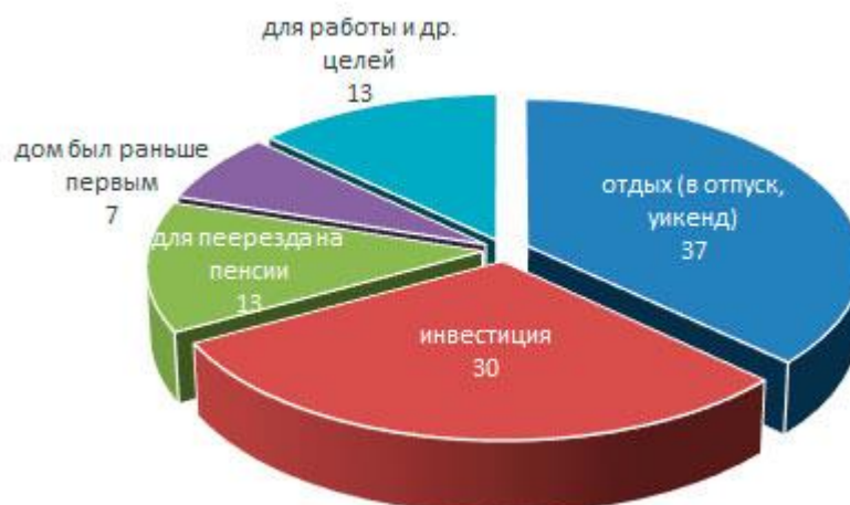
Рисунок 3. Мотивы владельцев вторых жилищ, % к сумме указанных причин (респондент мог назвать несколько позиций) по данным English Housing Survey. Household report 2008–09 London: Department for Communities and Local Government Publications, 2010.

https://www.gov.uk/government/uploads/system/uploads/attachment_data/file/6695/1750765.pdf