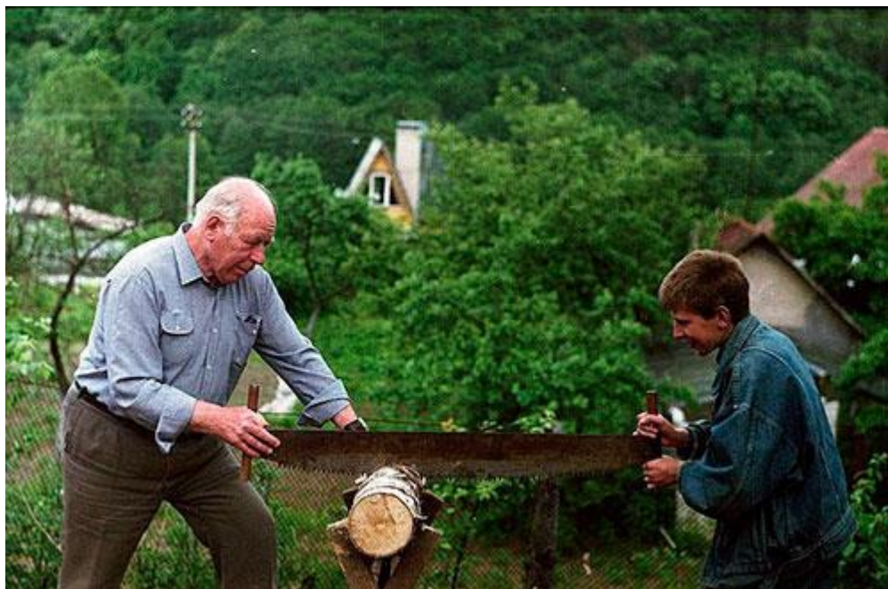
Рисунок 6. Дачная идиллия: межпоколенческий вариант

Резон 3. Переезд на ПМЖ в будущем: на пенсии, при дауншифтинге, с тем или иным расчетом на детей и внуков, учетом их интересов и вкусов. Идиллии по множеству причин может не получиться, но дачным философам присущи романтизм и надежды на гармонию поколений (рис. 6). Стесненные жилищные и в целом материальные условия в городе стимулируют, ускоряют дачный «уход» и «опрошение» старшей генерации в пользу младших. Тому же способствуют конфликты между ними, когда они признаны и не разрешаются иным путем. В любом случае и почти в любом возрасте дача (как, впрочем, любая недвижимость) становится оплотом жизненной перспективы и некоторой, всегда относительной, независимости.