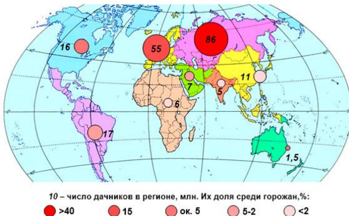
Рисунок 1. Число дачников (млн) и их доля среди горожан по регионам мира (%), оценочно

Сколько где дачников, вообще-то неизвестно. На рис. 1 их число грубо оценено по макрорегионам мира через страны, где данные хотя бы чуть надежнее, по аналогии распространенным на ближние и подобные. Хотя ошибки вероятны, несомненным лидером еще не так давно был СССР, а теперь Россия, где только садовых участков – 14 млн. (с учетом среднего коэффициента семейности получается около 40 млн. человек), тогда как всех вторых домов, например, в США – 5 млн. (12,5 млн. человек). А вот «дачеведение» в России развито слабо. Чтобы вникнуть в явление, ставшее одним из социальных брендов страны, нужно знать его формы и факторы.