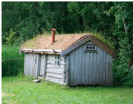
Рисунок 4. Дачная крепость в Подмоскowie Рисунок 5. Hytte (хижина, лачужка) в Норвегии

Резон 3. Переезд на ПМЖ в будущем: на пенсии, при дауншифтинге, с тем или иным расчетом на детей и внуков, учетом их интересов и вкусов. Идиллии по множеству причин может не получиться, но дачным философам присущи романтизм и надежды на гармонию поколений (рис. 6). Стесненные жилищные и в целом материальные условия в городе стимулируют, ускоряют дачный «уход» и «опрошение» старшей генерации в пользу младших. Тому же способствуют конфликты между ними, когда они признаны и не разрешаются иным путем. В любом случае и почти в любом возрасте дача (как, впрочем, любая недвижимость) становится оплотом жизненной перспективы и некоторой, всегда относительной, независимости.