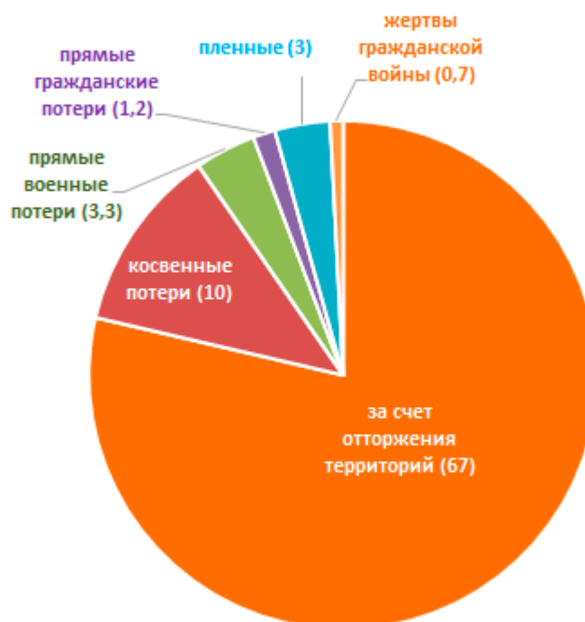
Рисунок 1. Демографические потери России в Первой мировой войне

*** Территория России в фактических границах означает территорию бывшей Российской империи без зоны германо-австро-турецкой оккупации.