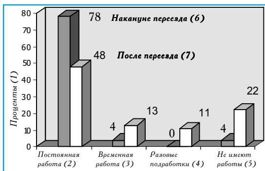
(1) %; (2) Travail permanent; (3) Travail temporaire (4) Travail d'appoint (à la tâche) (5) Sans travail; (6) A la veille de l'émigration (7) Après l'immigration

Рынки труда в больших городах еще и гораздо разнообразнее, и безработные переселенцы значительно реже, чем в селах, соглашаются на любую работу.