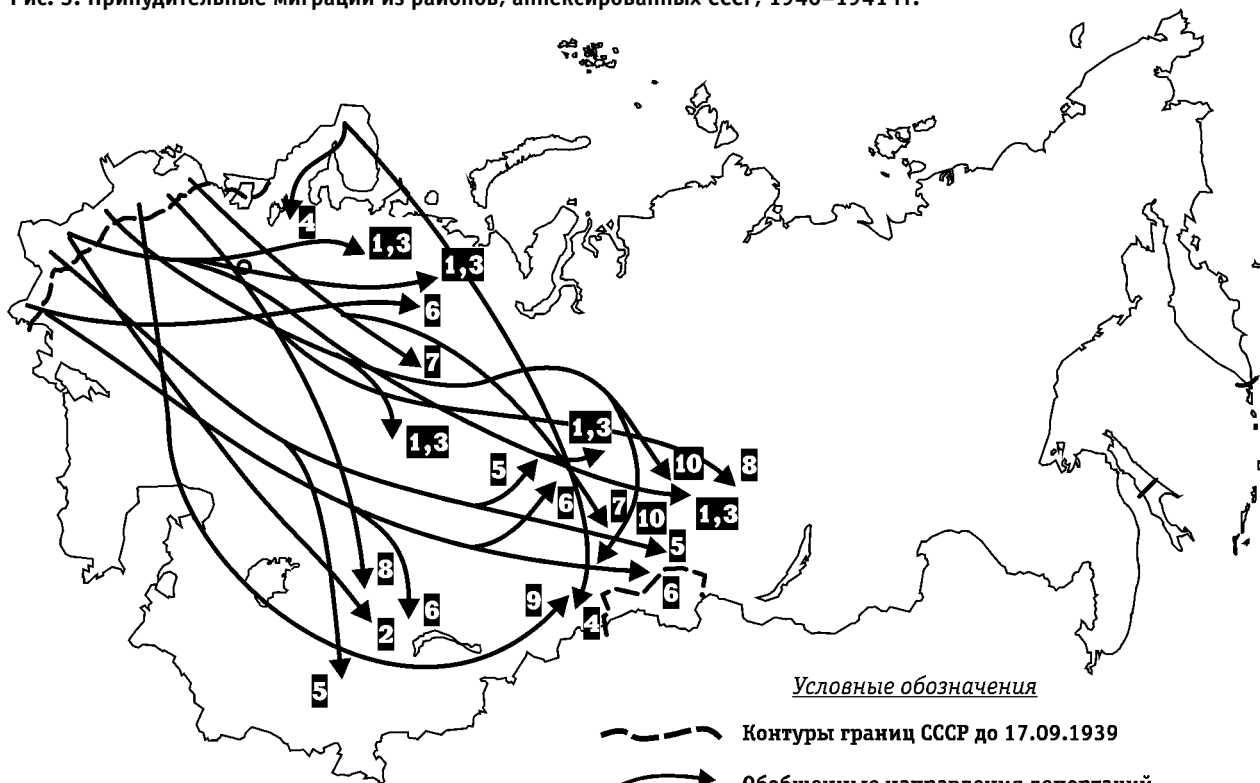
Рис. 3. Принудительные миграции из районов, аннексированных СССР, 1940–1941 гг.