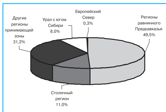
Fig. 2. Principales régions aux solde migratoire net intérieur négatif, nord-Caucase, 1991-2003 (%)